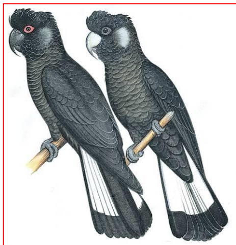
Samiec (po lewej), samica (po prawej)