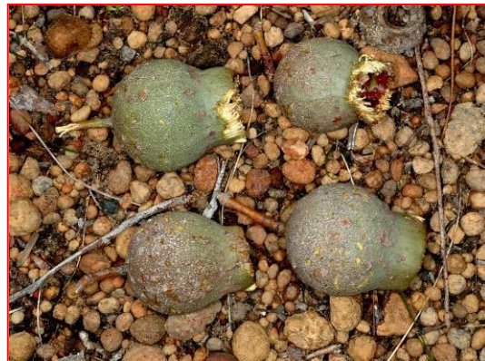
Żołędzie Marri pogryzione przez papugi Baudin